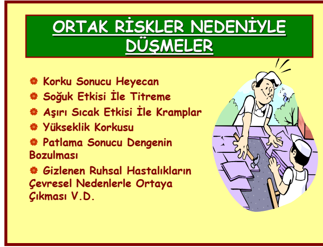
Şekil 3. Düşme tehlikesinin etkeni ile, insan özellikleri ve çevre özelliklerinin oluşturduğu ortak riskler

Hastada, düşmeyi oluşturacak insan özellikleri, azalan yaşam fonksiyonları nedeniyle önemli rol oynarken, belli bir çevrede yaşama zorunluluğu, çevresel özellikleri daha önemsiz kılmaktadır. Hastane çalışanları ise, tam tersi sağlıklı insanlar olduğundan, insan özelliklerinden ziyade, her ortamda olabildikleri için çalışma çevresi koşulları daha önem kazanmaktadır.