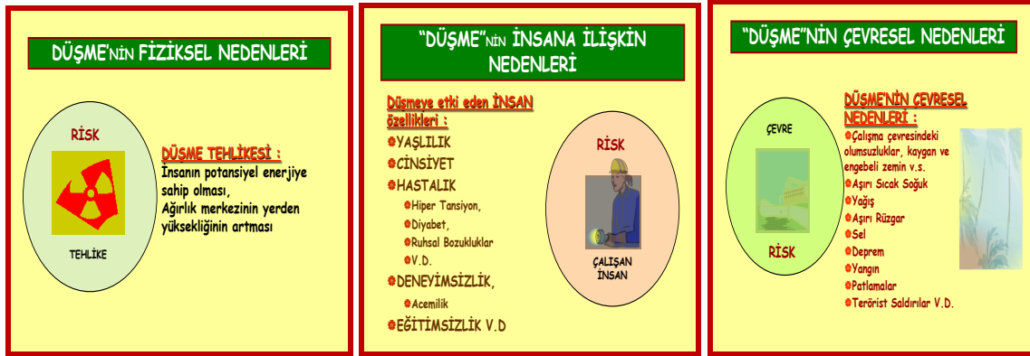
Şekil 2. Düşme tehlikesinin etkeni, insan özellikleri ve çevre özellikleri

Sağlık dengesini bozan hastalık etkenleri ile insana ait özellikler ve Çevresel nedenler bir araya geldiklerinde oluşturacakları ortak risklerin saptanması da çok önemlidir.