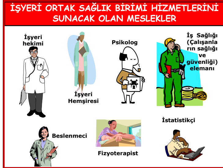
Şekil 1: İşyeri Ortak Sağlık ve Güvenlik Birimi (İOSGB) çalışanları

Hastanelerde, kurulacak olan Üç önemli Yönetim sistemi ile ilgili farklılıklar Tablo 2’de açık olarak ifade edilmektedir. Bu sistemlerin hizmet alanlarından daha somut örnekler vermek gerekirse, Hastanın